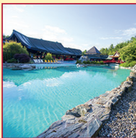
THERMALBAD mit über 1.400 qm Wasserfläche