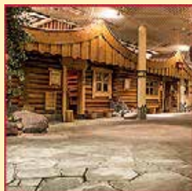
SAUNAWELT mit 11 Saunen und Infrarotstrahler Bereich