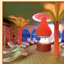
Wohlfühlwelten in 1001 NACHT mit Paradiesgarten