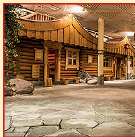
SAUNAWELT mit 11 Saunen und Infrarotstrahler Bereich