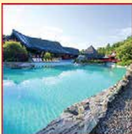
THERMALBAD mit über 1.400 qm Wasserfläche